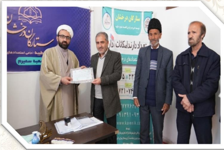
افتتاح شعبه سمیرم