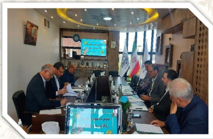
ببرگزاری ۱۳ جلسه هیئت مدیره قرض الحسنه ۹