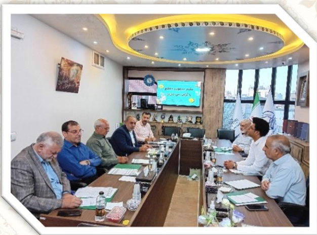
ببرگزاری ۳۳ جلسه هیئت مدیره خیریه