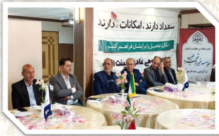
مجمع عمومی عادی خیریه شجره طیبه