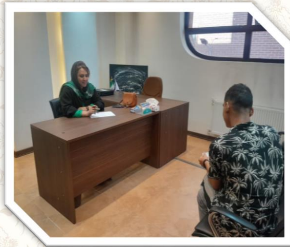
برگزاری جلسات مشاوره خانواده