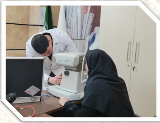
بینایی سنجی یاور خواهان